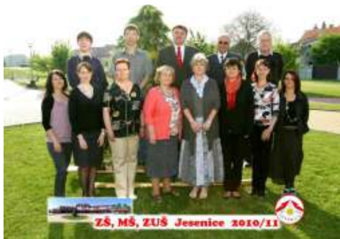
Pedagogové základní umělecké školy