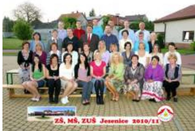
Pedagogové základní školy