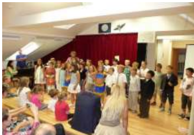
kolektiv žáků ze 3.C